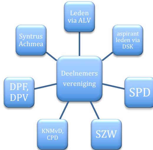
Afbeelding 1. Omgeving DPD

De vereniging heeft in haar omgeving contacten te onderhouden met verschillende partijen.